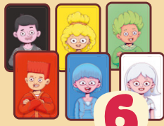
6 карт игроков