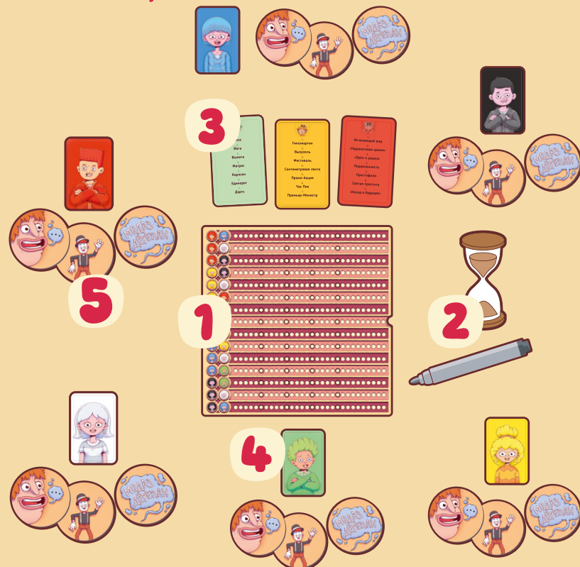
Пример подготовки игры на 6 участников